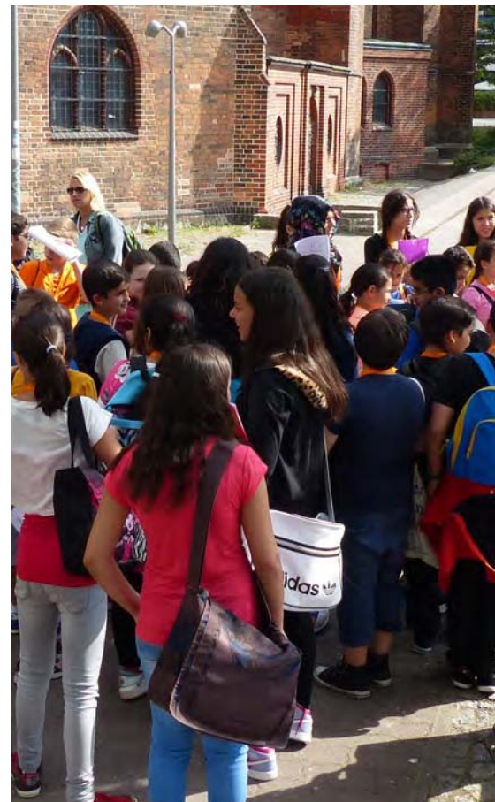
Schüler vor Ort bei der Marienkirche