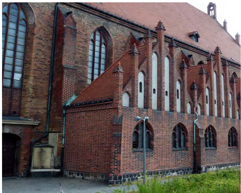
Kiche St. Marien, Berlin Mitte