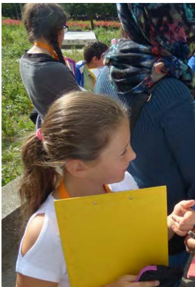
Schüler vor Ort beim Erkunden des Denkmals

Die Kinder sollen die historische Gebäude anschauen und dabei lernen, wie Architekten, Restauratoren und Kunsthistoriker in der Denkmalpflege und im Denkmalschutz arbeiten und warum deren Arbeit so wichtig ist.