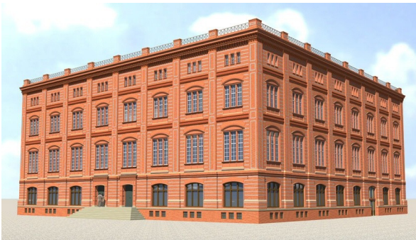
„Digitales Modell“ der Bauakademie

Im Auftrag des Landes Berlin hat die Liegenschaftsfonds Berlin GmbH & Co. KG im September 2008 das Grundstück, auf dem die Bauakademie von Karl Friedrich Schinkel stand, mit Bedingungen zum Verkauf ausgeschrieben. Der Erwerber wird verpflichtet, die Bauakademie wieder zu errichten, um dort u.a. den Betrieb einer Akademie für Architektur und Städtebau zu ermöglichen. Die Ausschreibungsfrist lief bis Ende November 2008. Die geeigneten Wettbewerbsteilnehmer sollen zeitnah zur Abgabe eines so genannten indikativen Angebots aufgefordert werden. Es ist nicht bekannt, wann mit Ergebnissen gerechnet werden kann.