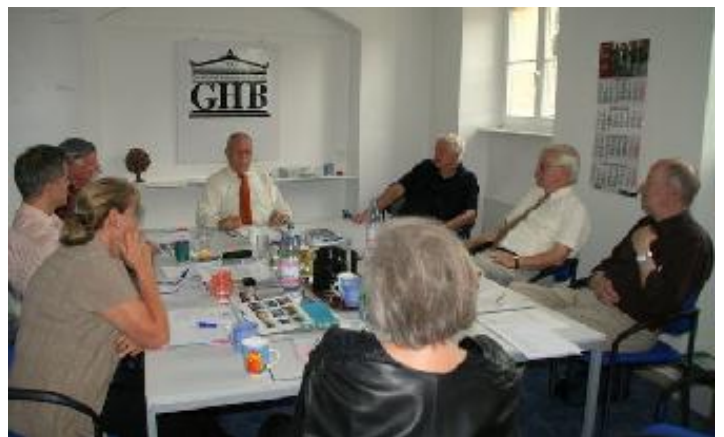
Vorstandssitzung in der Geschäftsstelle

In unserer Veranstaltungsreihe „Denkanstöße“ möchte der Vorstand in einer ersten Veranstaltung mit den Mitgliedern über die Gründung einer Arbeitsgruppe „GHB Zukunft 2015“ sprechen. Erste Themen sollten sein: „Ausrichtung des Vereins sowie Kommunikation und Vernetzung“. Für Themenvorschläge aus der Mitgliedschaft sind wir dankbar.