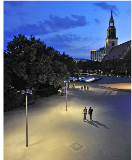
leerer Platz vor der Marienkirche