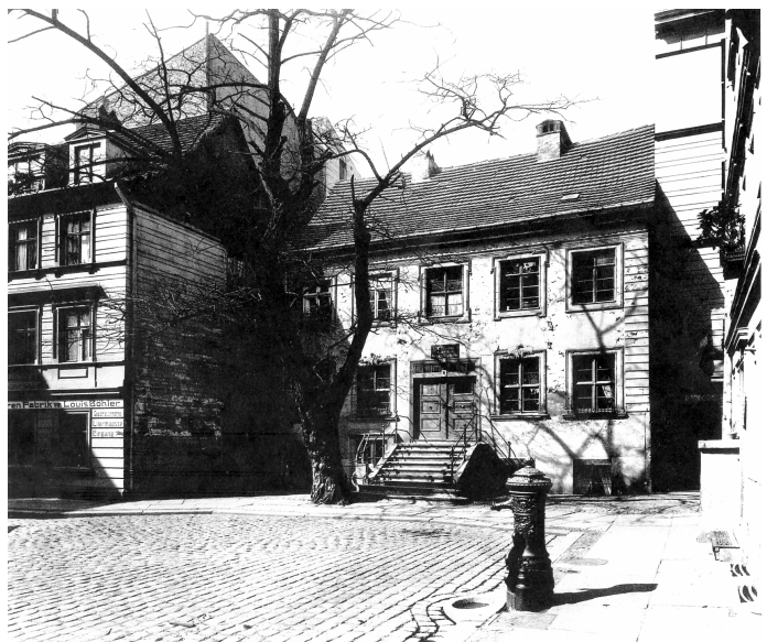
Bild 2 Großer Jüdenhof 1911

Im Bebauungsplan Klosterviertel/Molkenmarkt soll der Große Jüdenhof wieder als besonderes Altberliner Motiv kleinteilig, am alten Grundriss orientiert, gestaltet werden.