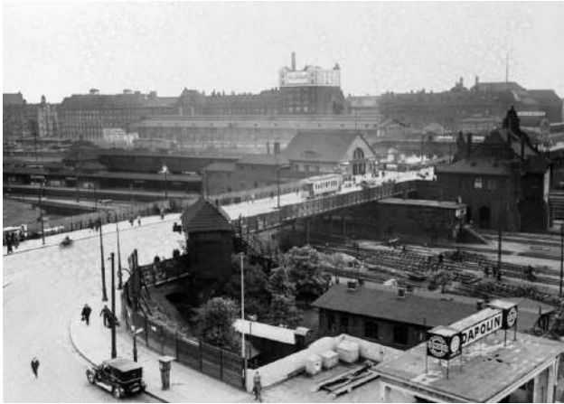
S-Bahn station Warschauer Strasse, 1930

Strecken der Stadt-, Ring und Vorortbahn verbanden zwar auch die Bereiche des späteren Groß-Berlin, eine besondere Bedeutung hatten sie für den Vorortverkehr aus den sich entwickelten Siedlungen im Umland.