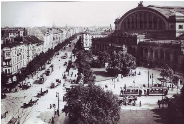
Askanischer Platz mit Anhalter Bahnhof

Lichterfelde wuchs bereits seit den 1870er Jahren zu einem Villenvorort. Die Anzahl der Vorortzüge auf der Anhalter Bahn nahm in den letzten Jahrzehnten des 19. Jahrhunderts beständig zu. Die stetig steigende Bevölkerung im Großraum Berlin führt zu einem Fahrgastanstieg auf den Vorortstrecken. Von 1887 bis 1899 stieg das Fahrgastaufkommen zwischen beiden Endbahnhöfen der Anhalter Bahn von jährlich 600.000 Fahrgästen auf über 3,2 Millionen Fahrgäste an. Hinzu kamen auf dem gleichen Abschnitt 52 Fernzüge. Die Dresdener Bahn, deren Züge ebenfalls im Anhalter Bahnhof begannen und endeten,