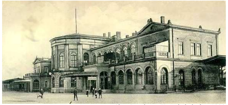
Alter Potsdamer Hauptbahnhof ca. 1900

1869 regten Grundstücksbesitzer den Bau einer Zweigbahn zur Erschließung des Geländes am Wannsee und Schlachtensee an. Die eingleisige Strecke sollte bei Zehlendorf aus der Stammbahn Berlin – Potsdam ausfädeln, in Schlachtensee und Wannsee jeweils eine Haltestelle bekommen und bei Kohlhasenbrück wieder in die Stammstrecke einfädeln.